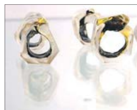
Bernhard Simon verarbeitet Glas und Metall zu ganz eigenständigen Formen und folgt damit nicht dem klassischen Mainstream.