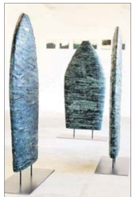
Den verhüllten Gesichtern von Beduinen hat Elfie Dollichon ein Denkmal gesetzt.