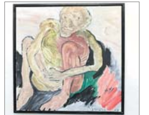
Robert Günzel entwickelt die Figürlichkeit aus der Farbe.