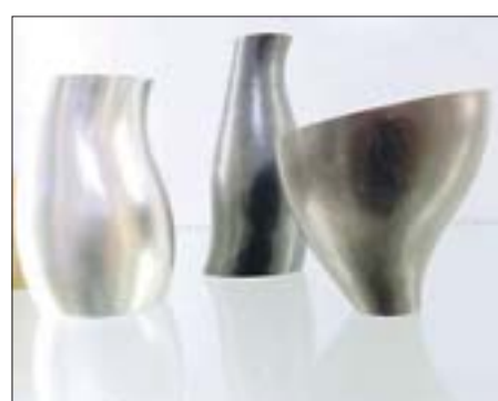
Elegant und schlicht: Lisa Böhmes Schalen sind im Studiengang Gestaltung der HAWK entstanden.